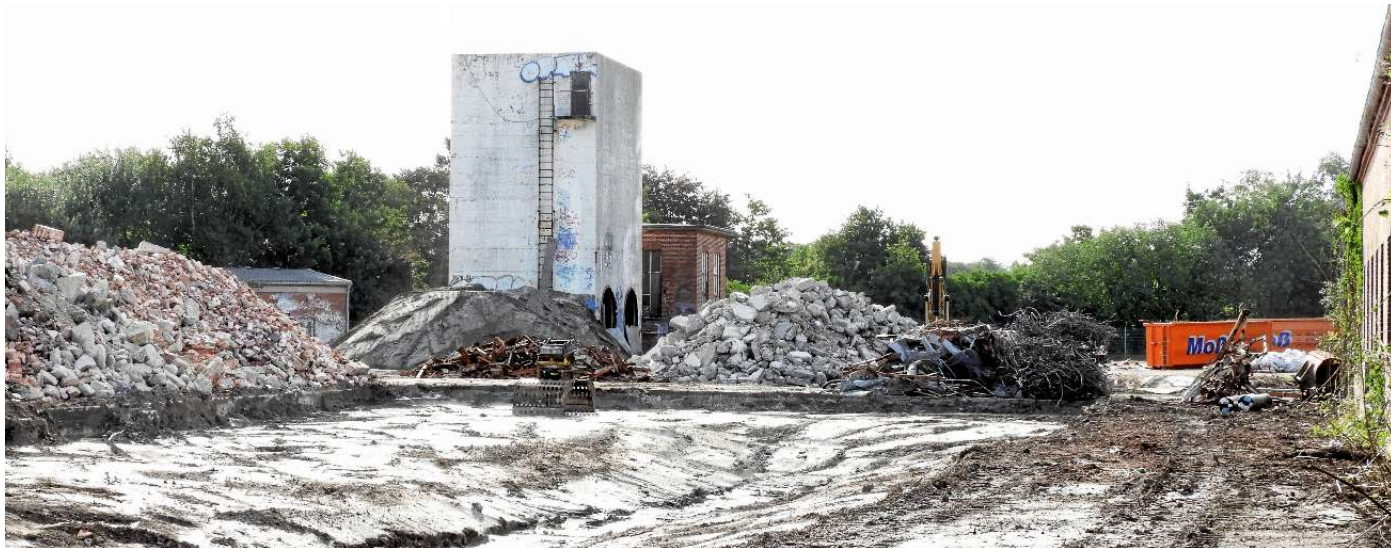
Mehrere Gebäude sowie das Kühlbecken auf dem Doornkaatgelände sind schon verschwunden.